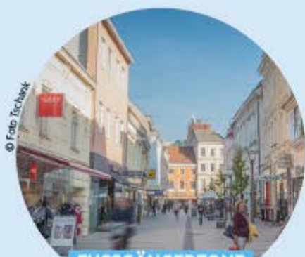
FUSSGÄNGERZONE HERZOG LEOPOLD-STRASSE