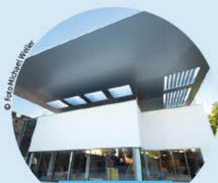
NEUES MUSEUM ST. PETER AN DER SPERR