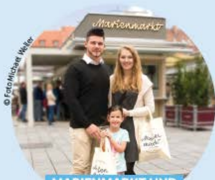
MARIENMARKT UND NEUGESTALTUNG HAUPTPLATZ