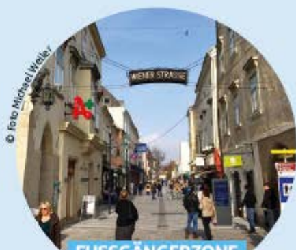
FUSSGÄNGERZONE WIENER STRASSE