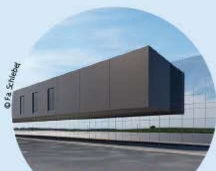
BETRIEBSANSIEDLUNGEN UND -ERWEITERUNGEN

durch die mehr als 250 Arbeitsplätze geschaffen werden konnten